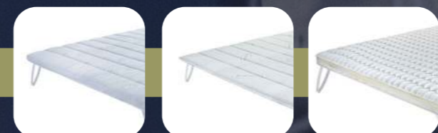
BASILICO CALENDULA CAMOMILLA