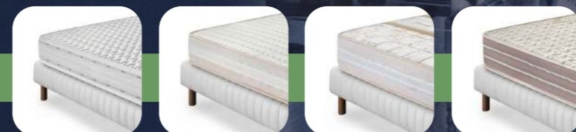
PRIMULA ALOE TARASACCO ANICE