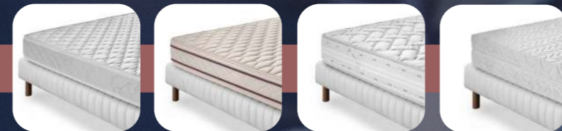
PINO TIGLIO SALICE QUERCIA